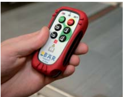
Dálkové bezkabelové ovládání s bezpečnostní funkcí.