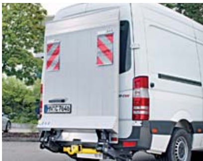
Bär VanLift Standard.