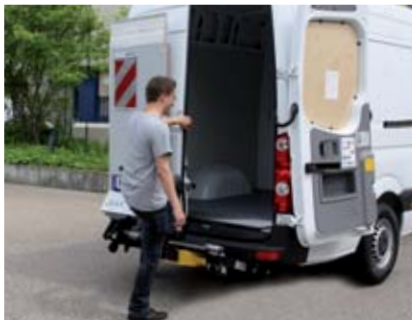
Volný, bezpečný přístup do vozu bez pohybu plošiny.