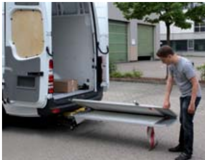
Hydraulické otvírání a ruční rozkládání.