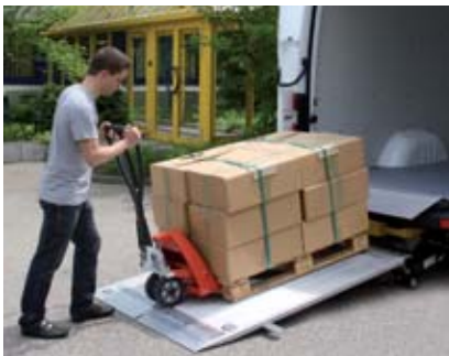
Dostatek místa pro europaletu a paletový vozík. Velmi plochý nájezdový úhel (7,7°).