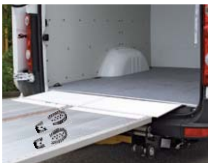
VanBridge spojuje podlahu ložné plochy vozidla s plošinou. Výškový rozdíl u standardní podlahy 12 mm.