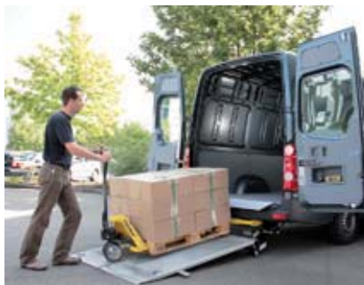
Dostatek místa pro europaletu a paletový vozík. Velmi plochý nájezdový úhel (7,7°).