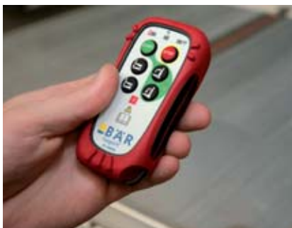
Dálkové bezkabelové ovládání s bezpečnostní funkcí.