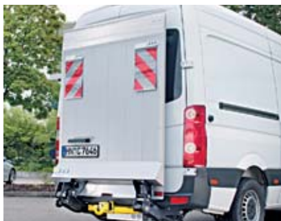
Bär VanLift Standard.