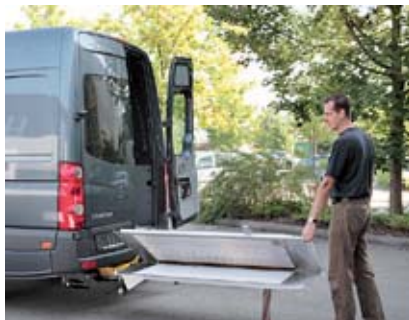
Hydraulické otvírání a ruční rozkládání.