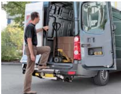
Volný, bezpečný přístup do vozu bez pohybu plošiny.